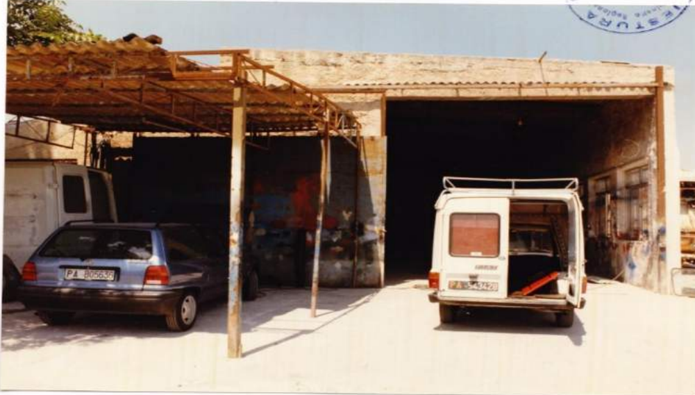
Ril. nr. 3 - Insieme dell'ingresso ai locali dell'officina.-